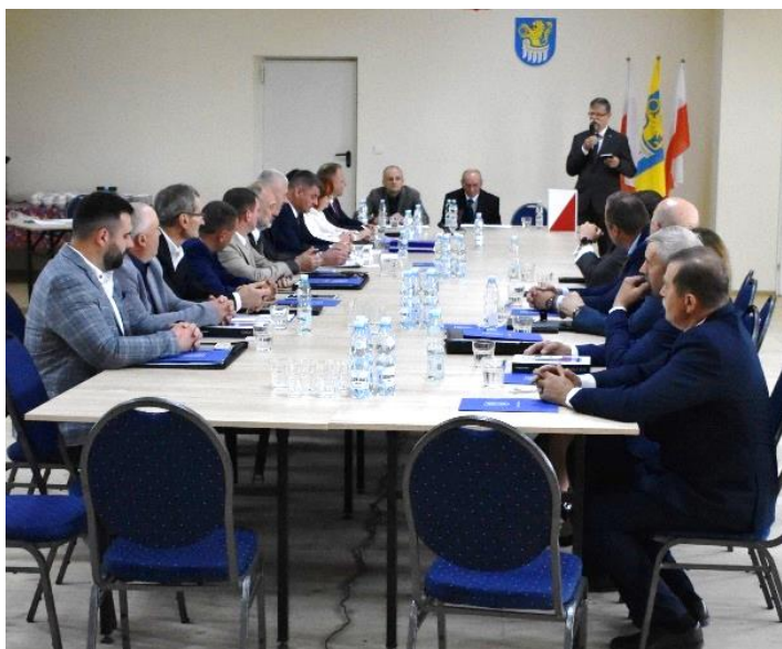
(Fotorelacja z I Sesji Rady Gminy)